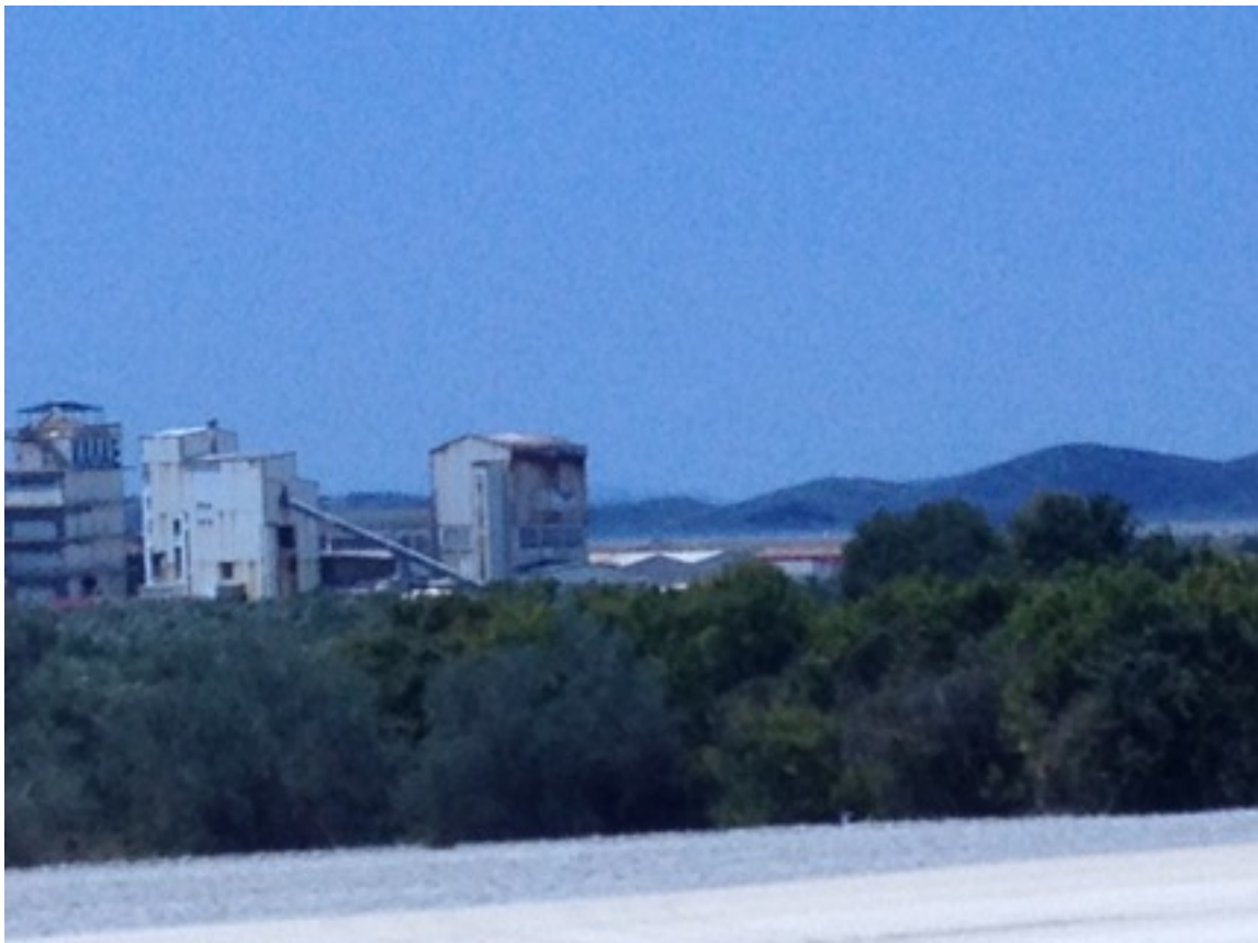
Rostande saltanläggning Messolongi

Föreliggande pamflett landar i slutsatsen att målen omgående måste sättas till att bryta maktlösheten under derivathushållningen och skuldberoendet och att djupa ingrepp därför måste göras i ackumulationskvoten för att undanröja utflödet till värdeproduktion, till förmån för resursflöden och industrialisering av arbetet.