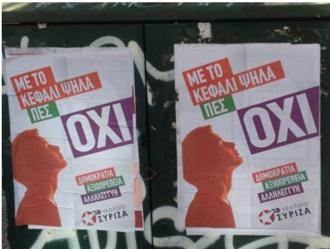
Valaffisch SYRIZA 5 juli.

rörelsen, tagit PASOKs roll som arbetarklassens domptör. men utan PASOKS, eller KKE:s, fäste i det fackliga organisationsväsendet. I stället vidmakthåller de en tradition med uppståndsaktivitet för att stärka sin påverkanskraft på kapitalet, staten och parlamentet.