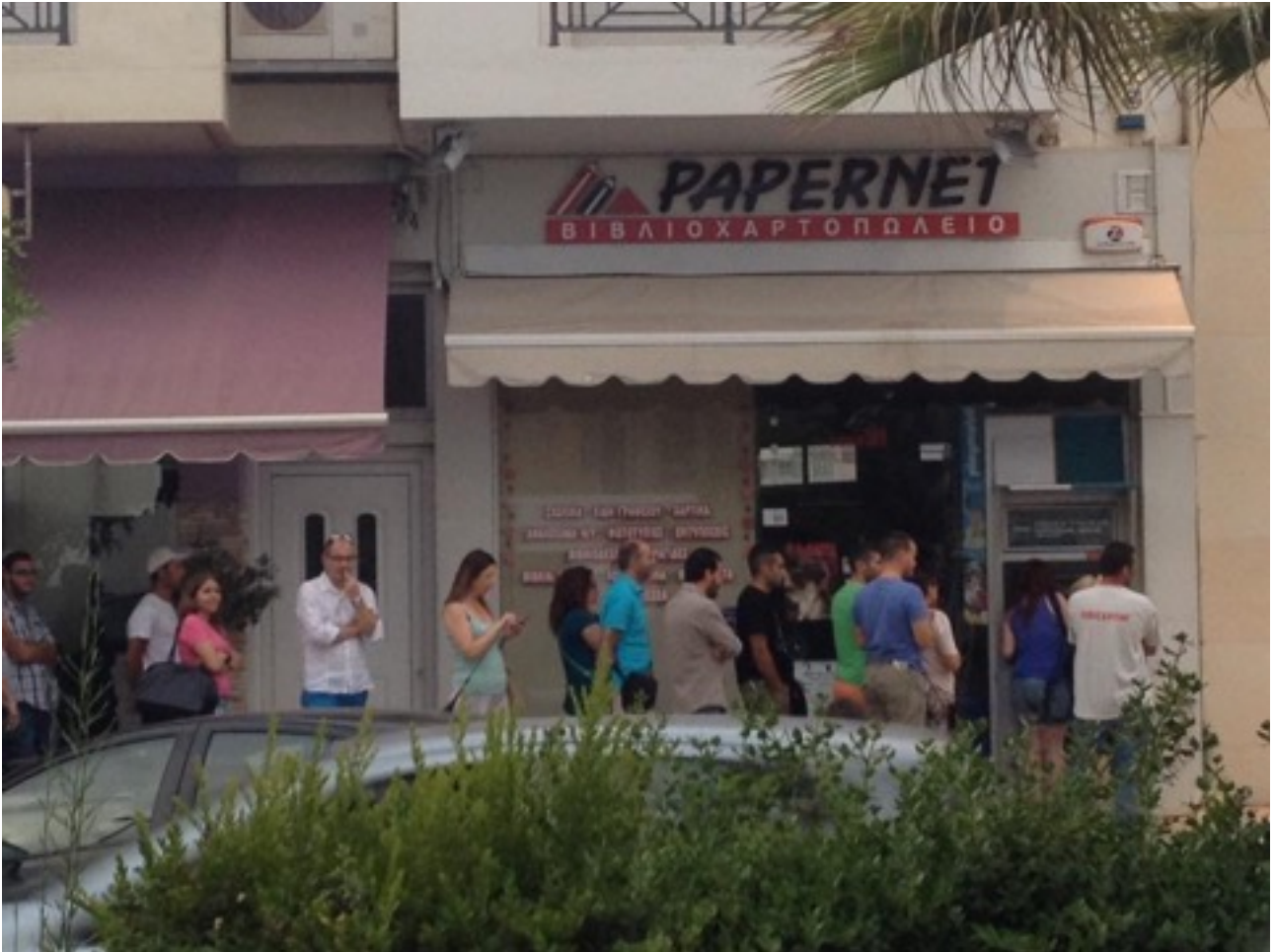
Kö för att ta ut dagens 60€, Heraklio Kreta 26 juni 2015

Den sociala revolutionens nödvändighet blyxtbelyst i euro-landet Grekland.