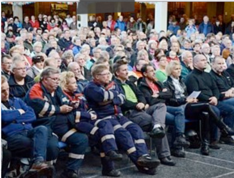
Stormöte i Kiruna Stadshus för akutkirurgin maj 2011

Våra samhällen lever och andas med gruvindustrin. Då ska också invånarna få verktygen att ta ansvar och planera för